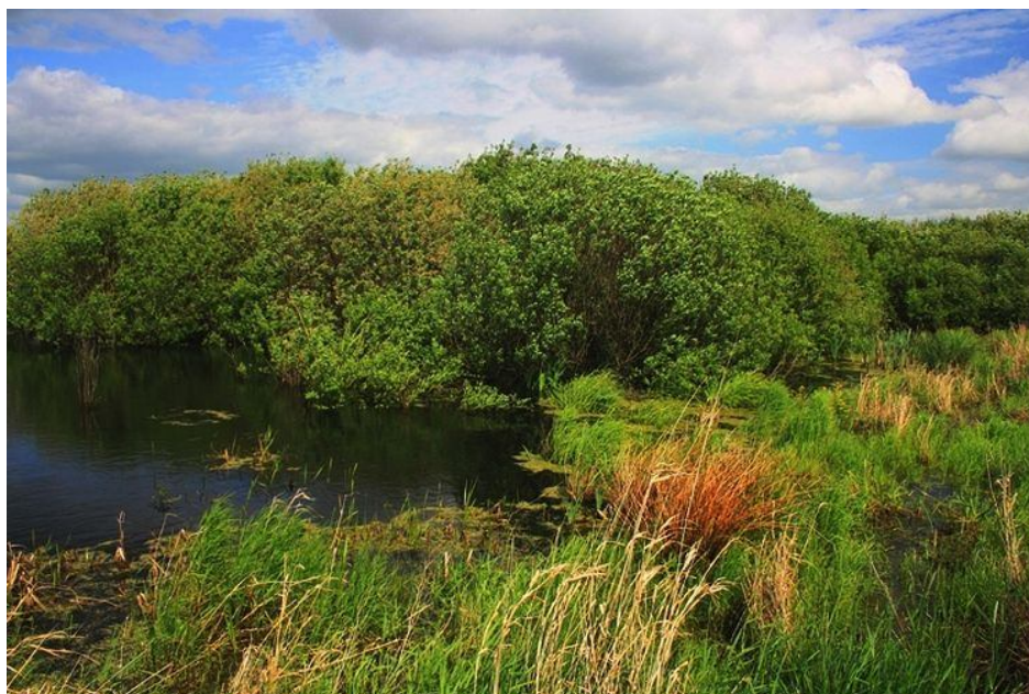
Staw śródpolny w Kotnowie

Klimat obszaru charakteryzuje przejściowość i zmienność ze średnią temperaturą roczną 6,5° oraz średnią roczną sumą opadów w granicach 530 mm. Najchłodniejszym miesiącem jest styczeń, a najcieplejszym lipiec. Szata śnieżna zalega na tym terenie średnio przez 30 dni w roku, co umożliwia wykorzystanie jej dla rekreacji zimowej.