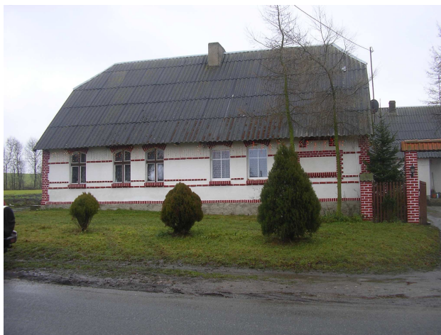
Dawny dom dla ubogich, ok. 1906 r., obecnie dom mieszkalny