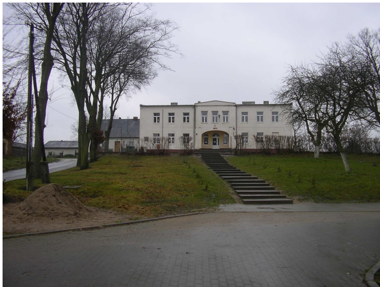
Pałac w Płachawach

W Płachawach znajduje się – zespół pałacowo – folwarczny z II połowy XIX w., na który składają się z dwóch części, pałacu murowany z II poł. XIX w., od 1804 r. – szkoła do 2012 r. oraz oficyny pałacowej. Po parcelacji ok. 1900 r. pałac i oficyna zostały gruntownie przebudowane, obecnie są jedynymi czytelnymi pozostałościami dawnego zespołu.