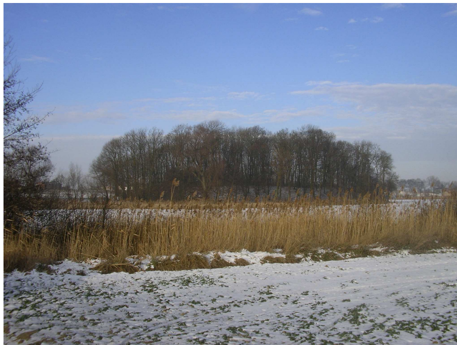
Grodzisko w Wieldządzu

Wieldządz to również środowisko kulturowe, znajduje się tu znajduje się tu "Góra Zamkowa" wpisany do rejestru zabytków.