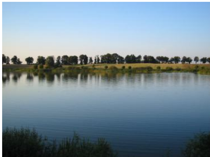
Jezioro od strony NWK

Oceniając klimat, występujący na obszarze opracowania, pod kątem warunków wypoczynkowych, należy zaliczyć go do dość korzystnych, przede wszystkim dla wypoczynku letniego.