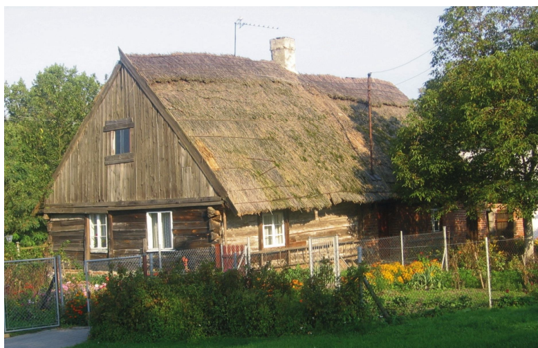
Chata pod strzechą