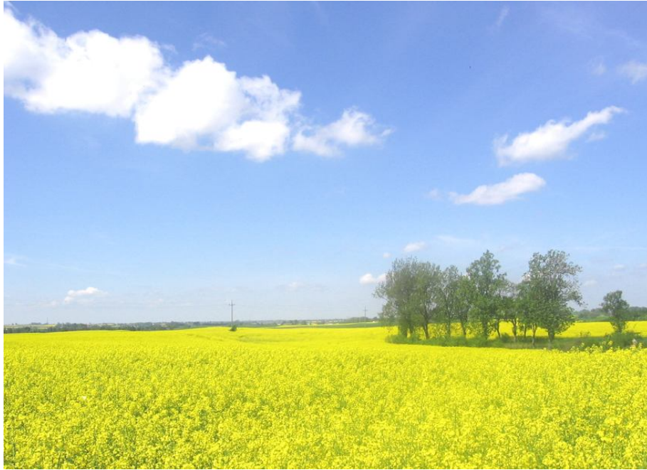
Pola uprane w miejscowości Goryń