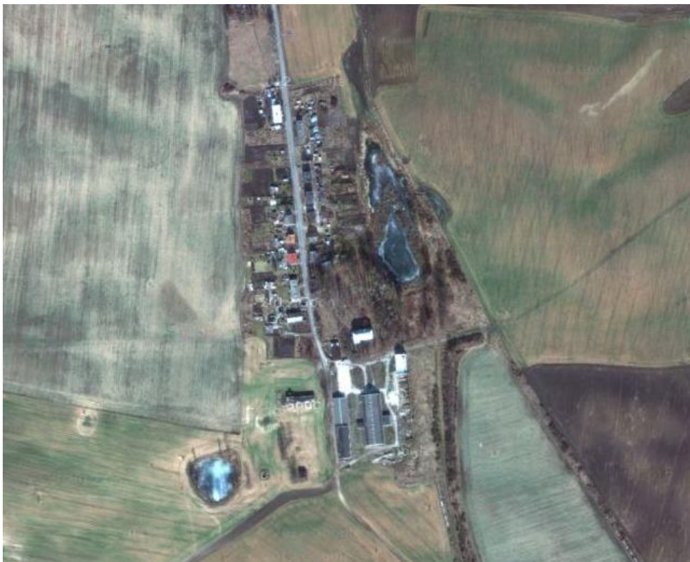
Zdjęcie satelitarne wsi Goryń

W Goryniu znajduje się pozostałość po dawnym parku dworskim z XIX wieku o pow. 1,4 ha. Miejscowość Goryń jest jednym z mniejszych sołectw gminy Płużnica, dawną wsią PGR-owską. Położona jest w północnej części województwa kujawsko-pomorskiego, charakteryzująca się bardzo urozmaiconą i atrakcyjną rzeźbą terenu. Układ taki powodował, że gleby już od dawna dobre nie były zalesiane, ale wykorzystywane rolniczo, przez co na terenie wsi występują jedynie niewielkie powierzchnie leśne (ok. 4 ha).