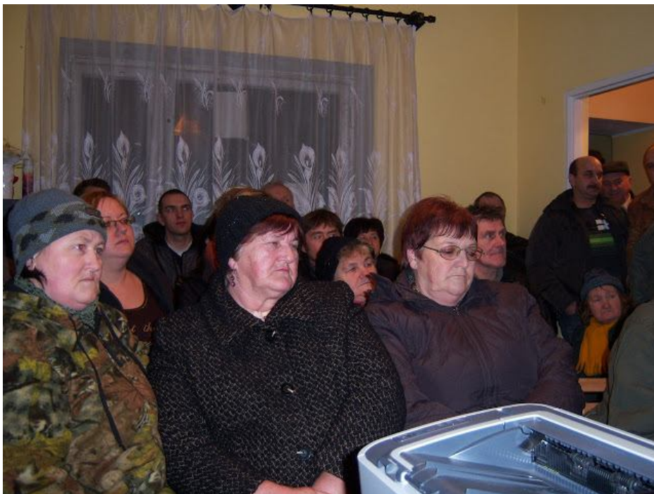
Zebranie wyborcze w Goryniu (18.01.2012)

Mieszkańcy wsi działają w Klubie Pomocy Rodzinie przy Stowarzyszeniu Klubów Pracy i Pomocy Rodzinie w Gminie Płużnica. Działacze społeczni zrzeszeni w organizacji działają głównie w sferze wsparcia i pomocy dla rodzin ubogich. Ponadto we wsi organizowane są różne formy spędzania wolnego czasu. Należą do nich: spotkania okolicznościowe (dzień dziecka, dzień kobiet, mikołajki), spotkania przy grillu, zabawy.